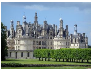
Castello di Chambord

Prima colazione e capatina ad Ars, piccolo villaggio reso famoso dal curato Jean-Marie Baptiste Vianney, Santo “Patrono di tutti i Parroci del Mondo”. Santa Messa e proseguimento per Chambéry. Pranzo in ristorante. Nel pomeriggio partenza per il rientro. Arrivo a Verona in serata.