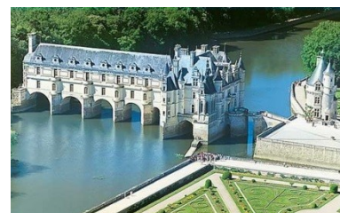
Castello di Chenonceaux