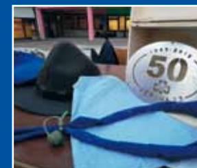
CINQUANT'ANNI E NON SENTIRLI