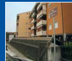
CRONACA DI UNA SCOPERTA